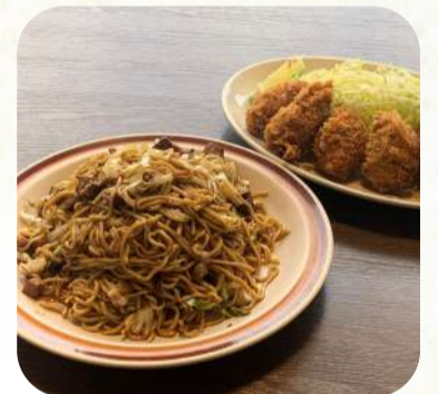
レストランよこた 木更津市清川 2-14-4

車好きの方におすすめのお店。館内のレストランやカフェからはポルシェを見ながら食事を楽しめます。