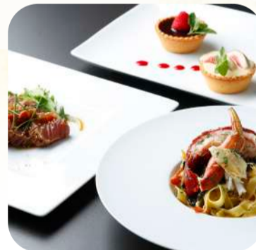
ポルシェエクスパリエンスセンター 木更津市伊豆島中ノ台 1148-1

地元で採れたお米やあさりを使った料理が美味しい木更津の人気店。名物のあさり御膳はメインを選べます。