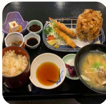
宝家 木更津市中央 2-3-4

山海の幸が集まる木更津は、食もハイレベルでバラエティー豊か。地元の人たちにも人気の飲食店をご紹介します。